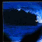
BARBADOS Kelly Slater