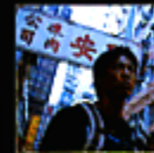
Hong Kong Kai, Ruzai