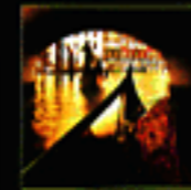
ITALY Timmy Curran